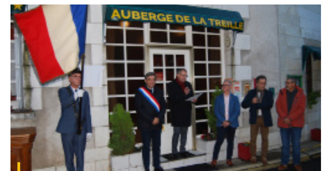
4 NOVEMBRE 2023 Cérémonie de commémoration des 80 ans du décès en déportation de Raymonde Sergent