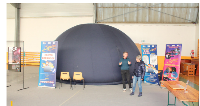
6 AU 11 NOVEMBRE 2023 Exposition scientifique au gymnase