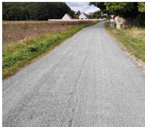
Gravillonnage rue du Gros buisson

NB : les chemins ruraux font partie du domaine privé de la commune et ne sont donc pas soumis aux mêmes obligations.