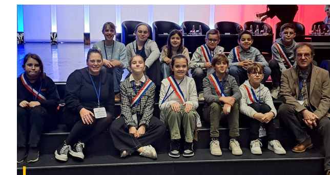
29 NOVEMBRE 2023 Présence du Conseil municipal des Jeunes au Congrès des maires d'Indre-et-Loire

19 janvier Cérémonie des vœux du maire, à 19 h au gymnase.