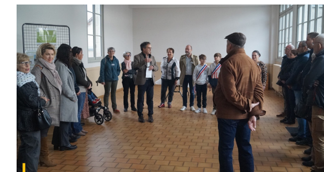
18 NOVEMBRE 2023 Cérémonie d'accueil des nouveaux arrivants

Du 6 au 11 novembre dernier, la commune a accueilli au sein du gymnase une exposition scientifique itinérante sur le thème de l'Astronomie. Proposé par Centre Sciences et la FRMJC (Fédération Régionale des Maisons de la Jeunesse et de la Culture), cet évènement culturel a été proposé aux élèves de la commune, mais également au grand public, venu très nombreux. Entre modules et panneaux interactifs proposant des expériences ludiques sur l'espace et le temps, et le planétarium gonflable projetant un spectacle numérique et immersif à 180°C, les quelques 400 visiteurs et 300 élèves ont pu profiter d'une expérience unique les transportant aux confins de l'Univers. Forts de ce succès, la commune espère pouvoir de nouveau se porter candidate dans deux ans afin d'accueillir ce dispositif sur un autre thème scientifique. ●